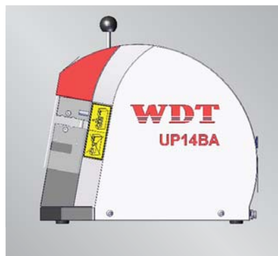
UP 14 BA | scherenbewegt UP 14 BA | radial closing mechanism