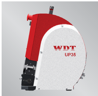
Pneumatische Crimpmaschine UP 35 Pneumatic crimping machine UP 35