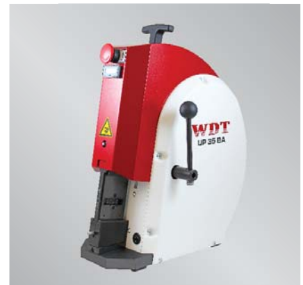
Pneumatische Crimpmaschine UP 35 BA Pneumatic crimping machine UP 35 BA