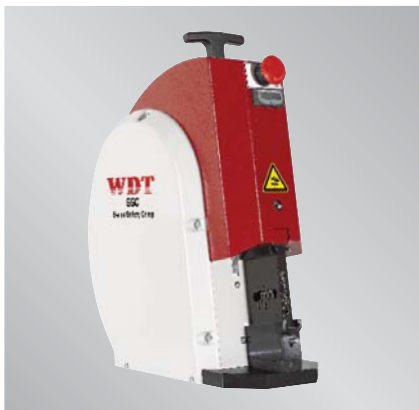
Pneumatische Crimpmaschine SSC Pneumatic crimping machine SSC

Our pneumatic crimping machine series UP 35 | SSC – A professional enhancement for your production!